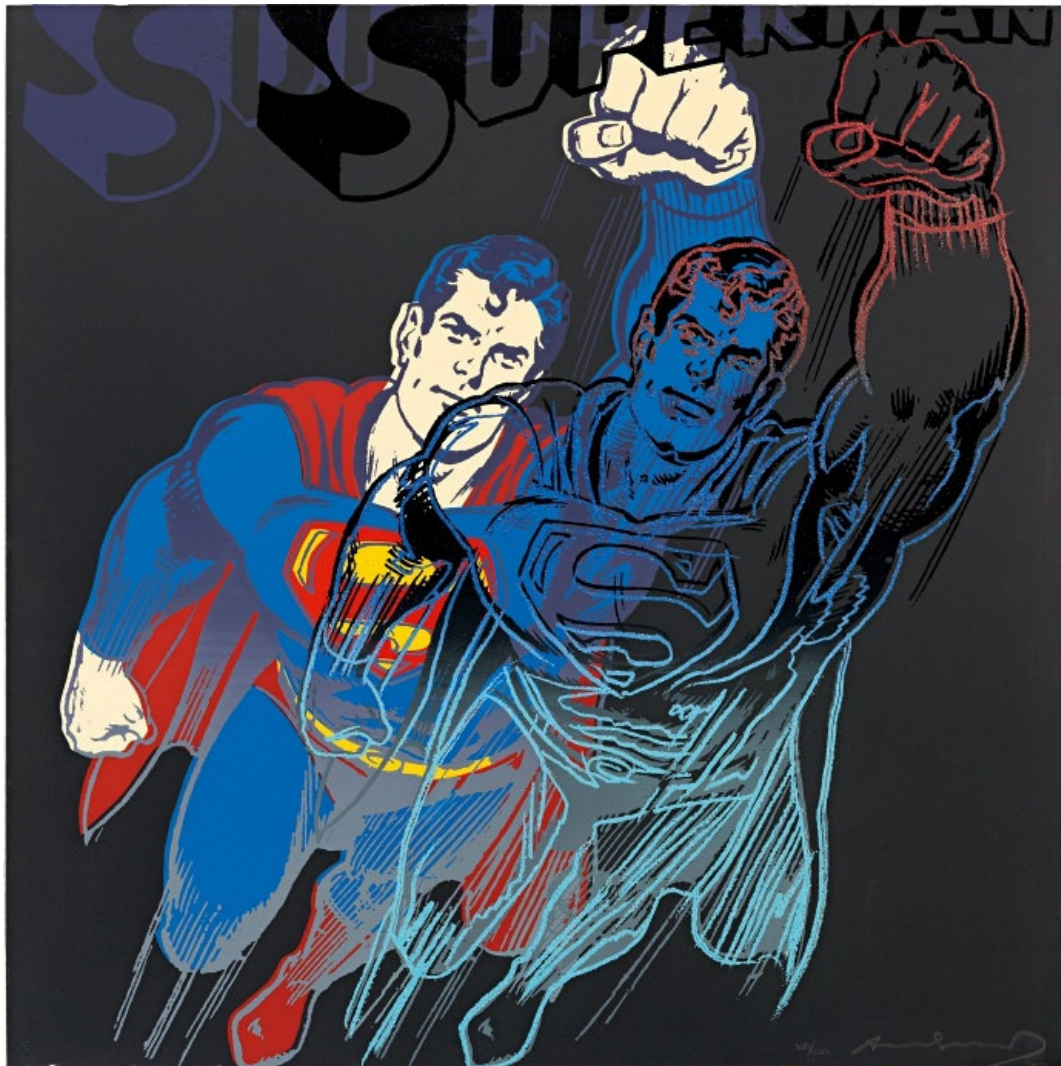
Ill. 4 : Andy Warhol, Superman, sérigraphie, 1981