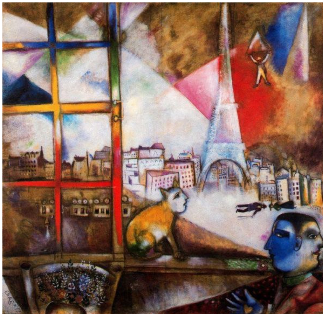
Ill. 9 : Marc Chagall, Paris par la fenêtre , huile sur toile, 1913

Réveries et autres histoires : Réfléchis à la manière dont l'expérience et les souhaits, le souvenir et le rêve se recourent. Construis une composition picturale qui restitue ton univers mental. Utilise à cet effet le motif de la fenêtre pour mettre en relation divers niveaux de l'imagination (cf. ill. 9).