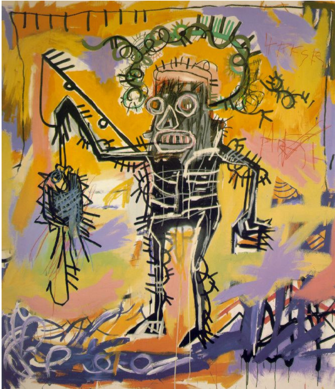
Ill. 5 : Jean-Michel Basquiat, Fishing , peinture à l'huile, 1981