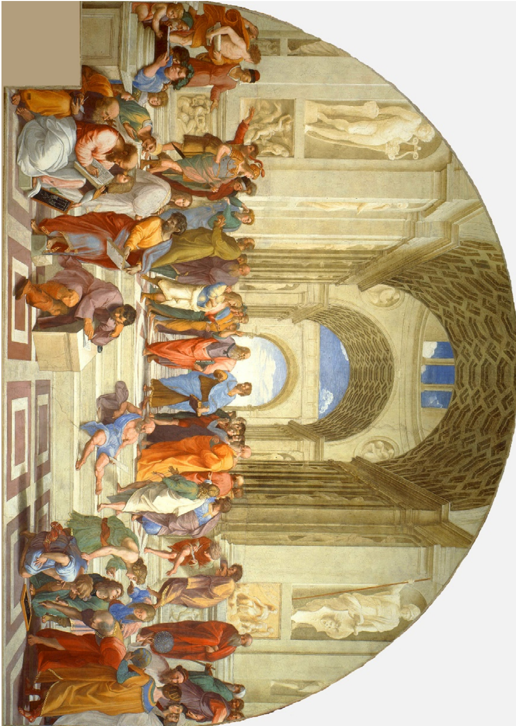
Ill. 7 : Raphaël, L'École d'Athènes, fresque, 1510 – 1511