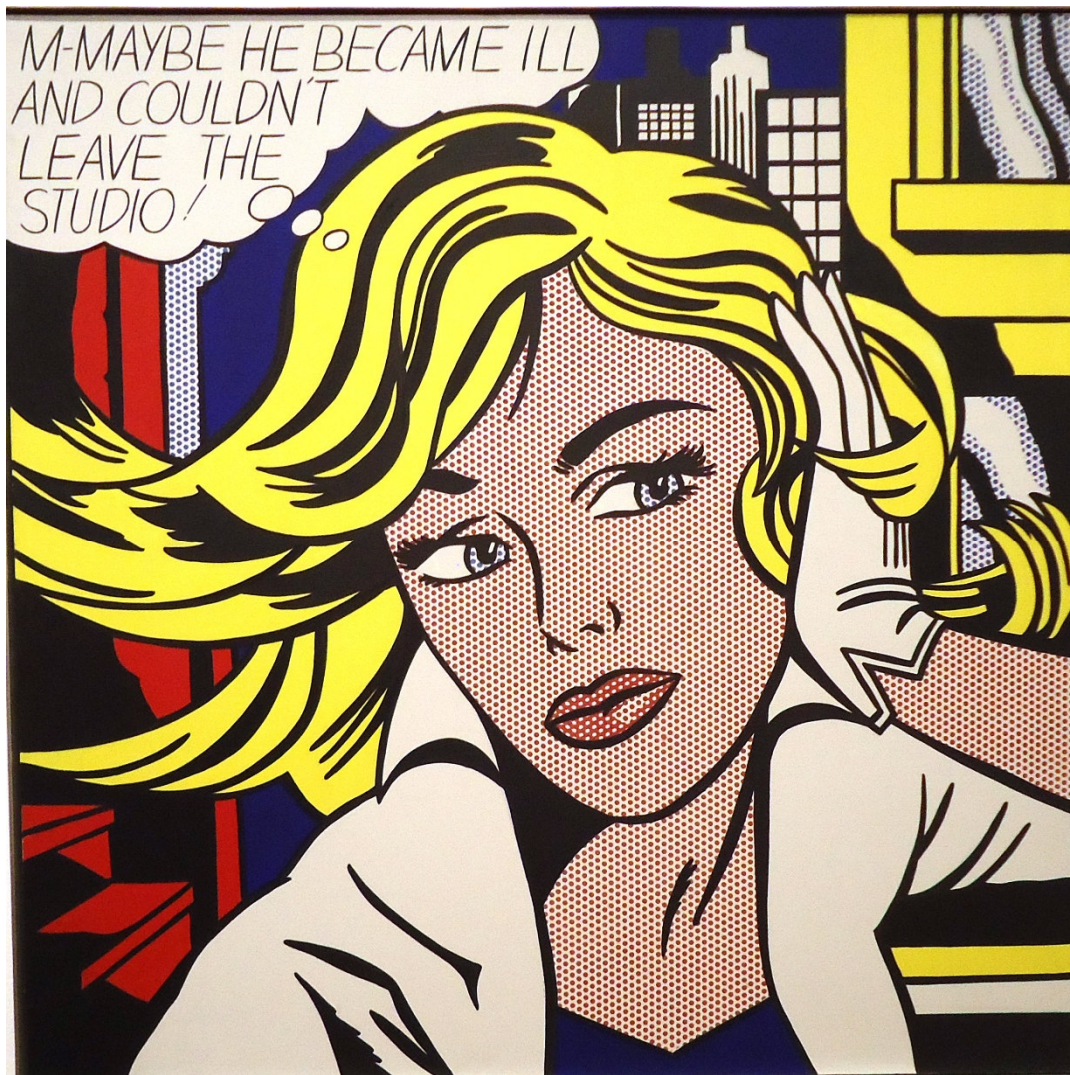
Ill. 8 : Roy Lichtenstein, M-Maybe « P- Peut-être », peinture, 1965

Lichtenstein s'inscrit dans le mouvement artistique du pop art qui depuis les années 1960 intègre dans l'art les images provenant de la culture de la consommation et de la culture de masse. Mais l'art n'est pas seul à s'inspirer de la culture du quotidien : inversement, les images artistiques se retrouvent aussi dans le quotidien. En ce sens, il s'agit donc d'une interaction entre l'art et le quotidien. Ceci laisse penser que les frontières entre l'art et le quotidien ont de plus en plus tendances à se mêler.