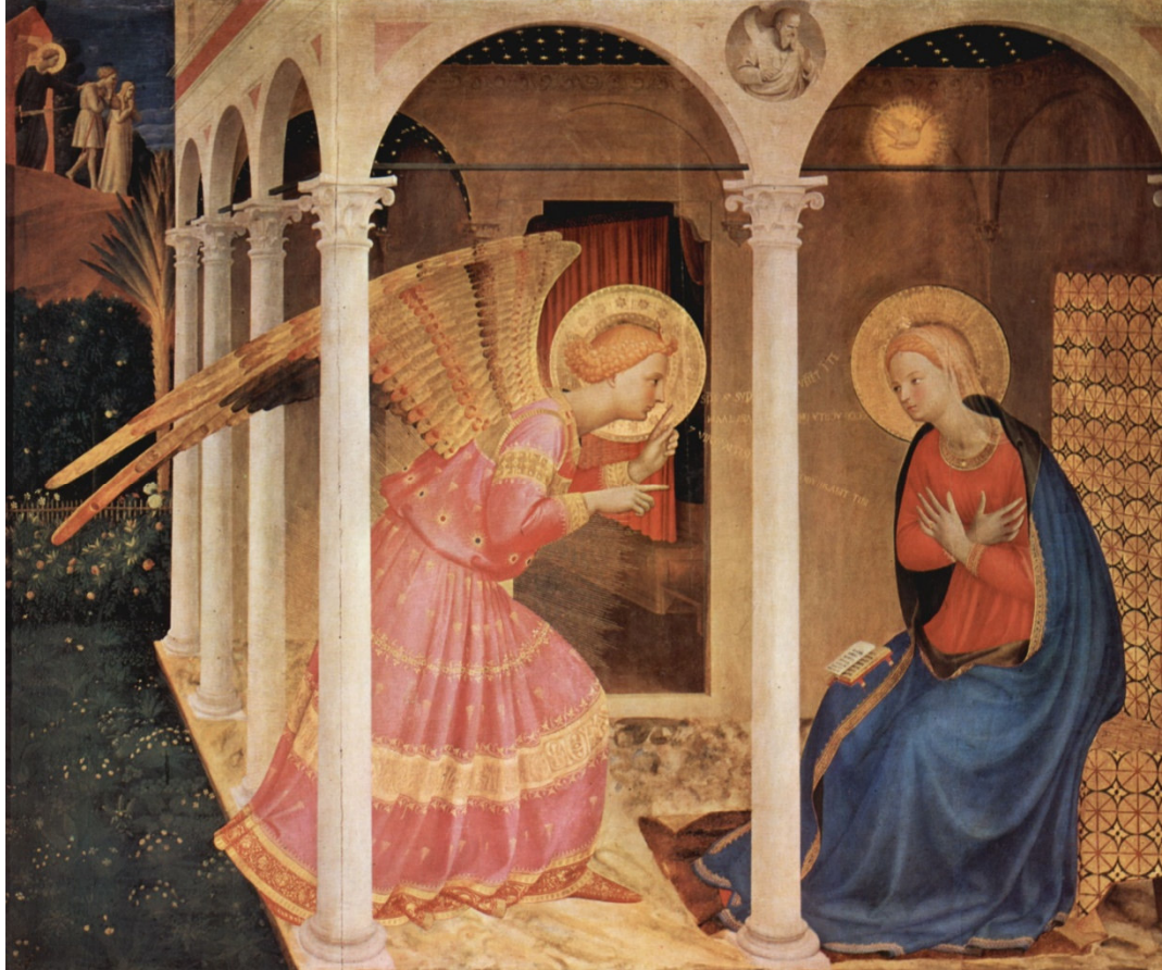
Ill. 2 : Fra Angelico, L'Annonciation de Cortone , tempera sur panneau de bois, 1433 / 1434

On pourra prendre comme exemple l'œuvre de Fra Angelico L'Annonciation faite à Marie (1433 / 1434) : Sur la gauche, on voit l'Expulsion du Paradis terrestre, au milieu l'ange délivrant son message et à droite Marie en train de recevoir le message (cf. ill. 2). Si le tableau a une structure non simultanée, les images sont disposées selon la direction de la lecture. Les représentations peintes sur les vases grecs en sont un excellent exemple. Cette technique narrative a connu une renaissance dans la bande dessinée.