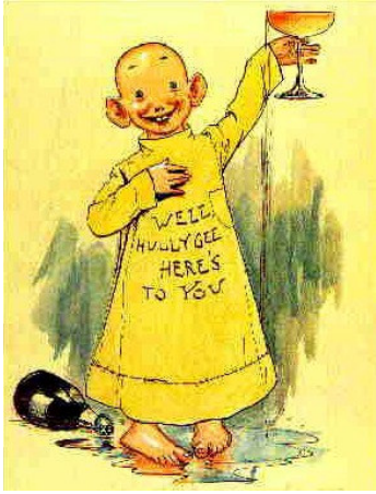
Ill. 3 : Richard F. Outcault, Yellow Kid « L'enfant en jaune », 1895