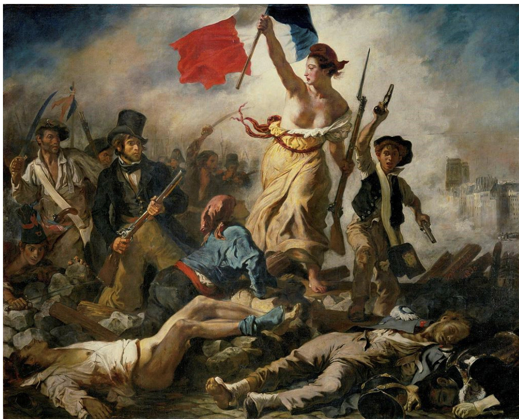
Ill. 1 : Eugène Delacroix, La Liberté guidant le peuple , peinture à l'huile, 1830

Il est évident que les images racontent des histoires : il suffit pour s'en convaincre de songer aux peintures rupestres préhistoriques et à leurs interprétations. Qu'elles aient eu des finalités religieuses, pratiques ou artistiques, elles représentaient ce que les personnes avaient vécu, rêvé ou souhaité. La peinture historique , qui est apparue plus tard, en est l'exemple par excellence. Elle servait à faire passer un message moral en montrant des scènes religieuses ou historiques. C'est par exemple pendant la Révolution française qu'Eugène Delacroix a peint le tableau La Liberté guidant le peuple (1830) (cf. ill. 1).